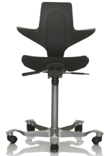
HÅG Capisco Puls B020 Musta