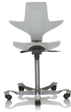
HÅG Capisco Puls B010 Vaaleanharmaa