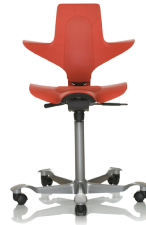
HÅG Capisco Puls B010 Punainen