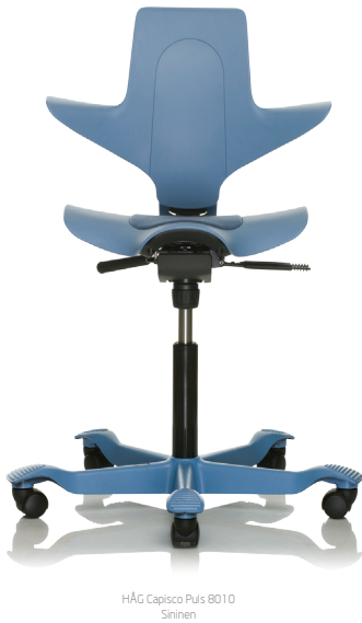
HÅG Capisco Puls B010 Sininen