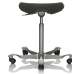
HÅG Capisco Puls B002 Musta