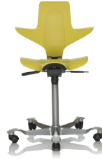
HÅG Capisco Puls B010 Keltainen